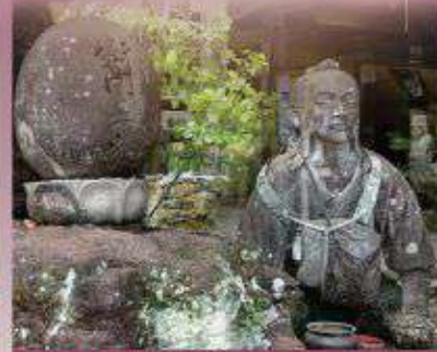
51番 石手寺 (酒路の元祖・衛門三郎)