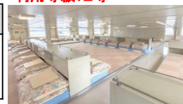
※2等寝台等の上等級変更もできます。片道@1,800円増し