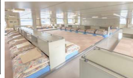
※2等寝台等の上等級変更もできます。 片道@1,800円増し